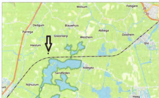
Ligging "De Tempel" tussen Sneek (rechts boven) en Workum (links onder)